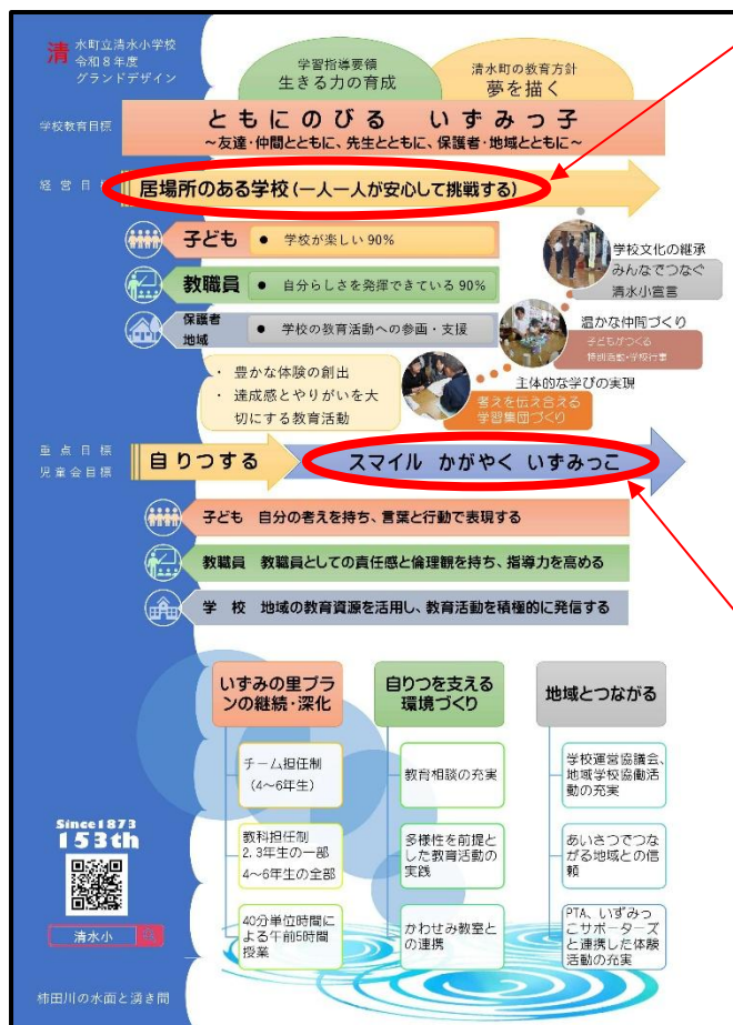
令和8年度 清水小グランドデザイン

清水小では、「ききかた名人」を目指そうと教育活動の様々な場面で取り組んでいます。今年度の学校経営目標「 居場所のある学校 （一人一人が安心して挑戦する）」の実現に向けた取組の1つです。「聞いてくれる人がいる」から「安心して話すことができる」わけで、その場所がお互いの居場所となります。そんな居場所が広がることで、いずみっこは安心して挑戦できます。